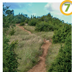
Sentier sur le roc Deymié